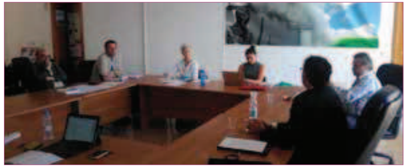
Fig. 2. La prima riunione del gruppo di ricerca presso la Fondazione VeRiPa (24 maggio 2018).

Il compito principale è quello di unire le competenze che ciascuno dei membri vanta nel campo di diritti uma-