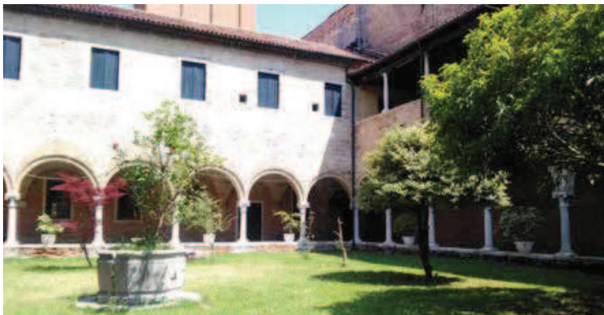
Fig. 3. Il Chiostro di Sant'Elena a Venezia, sede della Fondazione VeRiPa.